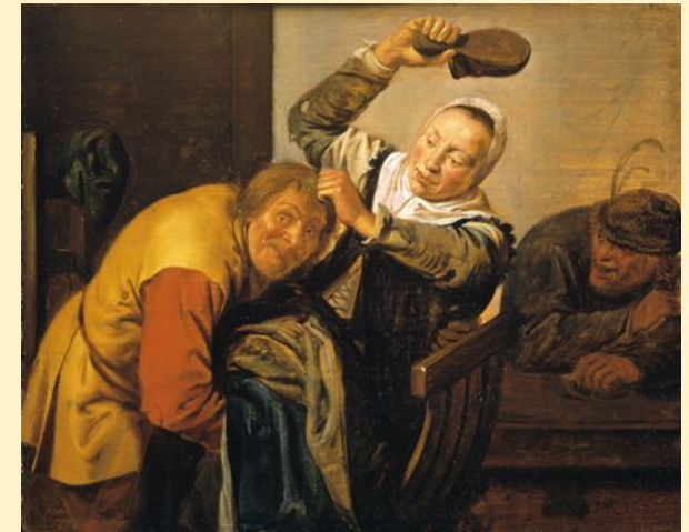
Jan Miense Molenaer, Los cinco sentidos, el tocar , 1637.